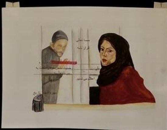
مگه شوهرت میزاره؟ Does your husband let you?