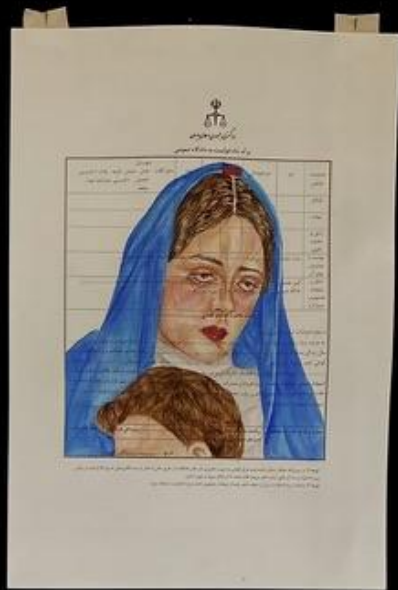
ضعیفه. A weak human being.