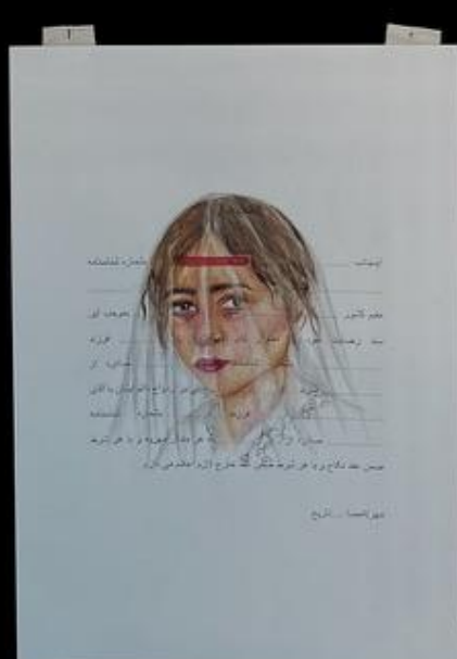
يا لباس سفيد ميايى با لباس سفيد ميرى. You arrive with a white dress and you go with a white coffin.