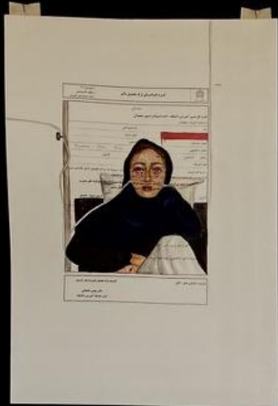
ما پسر میخواستیم خدا به ما دختر داد. We wanted a boy, God gave us a girl.