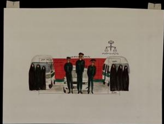
زنی دینگا! It's because you're a woman!