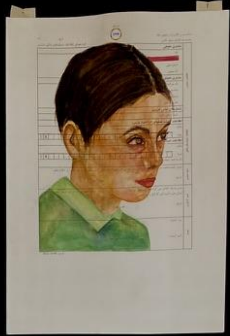
ختیلى مرزى. You are as capable as a man.