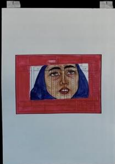
این همه از من ارزش باید پوشاک بچه چیدن کنی. After all this study, you have to change the baby's diaper.