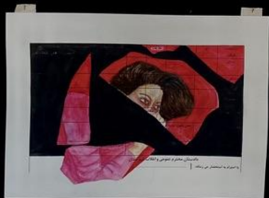
لیسنت جوردم She is not pure