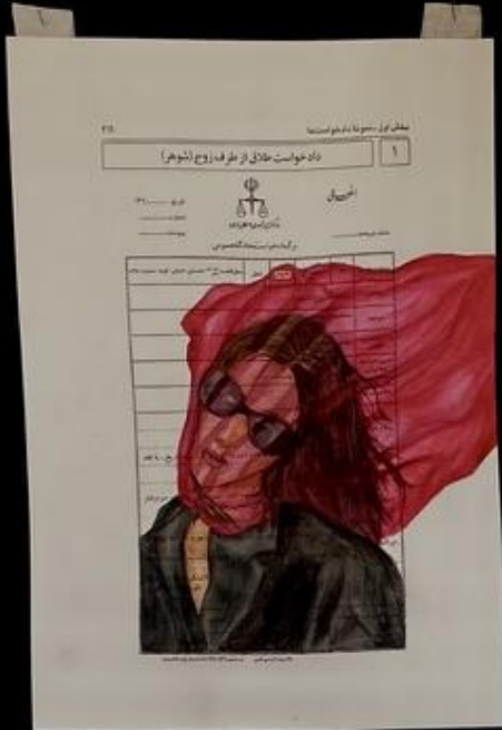
میترا شی Your time for marriage will pass and you will rot