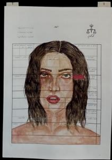
زن خوب همیشه پای خوله زانگن و میسازد. A good wife tolerates everything and keeps her marriage.