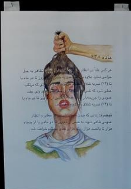
زانى كه اينجورى لباس ميپوشه حقيقتش پيش تماوز تته. A woman who dresses like this can rightfully be raped.